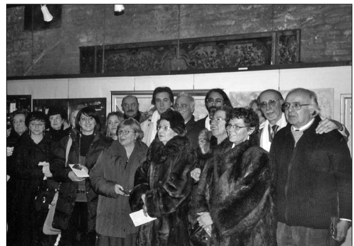
Protagonisti della mostra all'inaugurazione